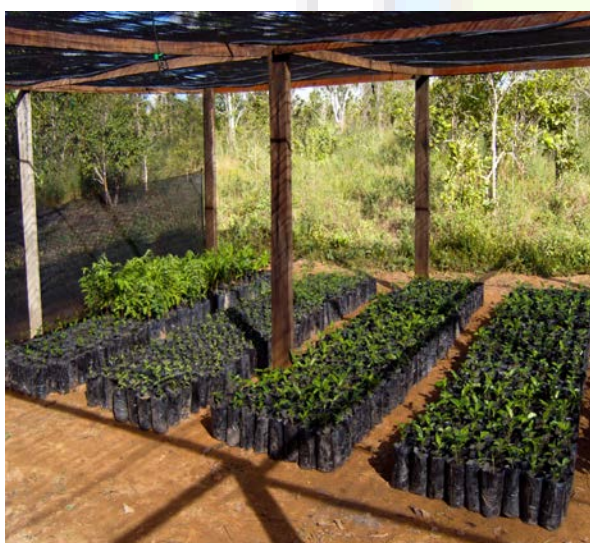
Semilleros del proyecto.

El segundo proyecto justificado financiado por el Ayuntamiento de Soria en la convocatoria del 2011 fue el titulado: "Consolidación de cadenas productivas basadas en la fruta y las semillas de la Amazonía, optimizando y ampliando los cultivos de árboles frutales, fortaleciendo la organización campesina e indígena de la región y sensibilizando a sectores estratégicos de la sociedad sobre la importancia de la conservación de la biodiversidad de la Amazonía" , con un presupuesto total de 111.790 Euros y financiado por el Ayuntamiento de Soria con 36.105 Euros.