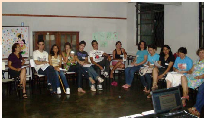
Participantes de uno de los cursos de formación de líderes. Montes Claros. Brasil.