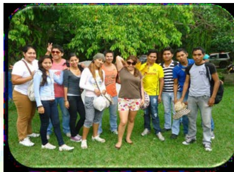
Jóvenes beneficiarios del proyecto Becas en el 2013 en Sta. Cruz de la Sierra. Bolivia.