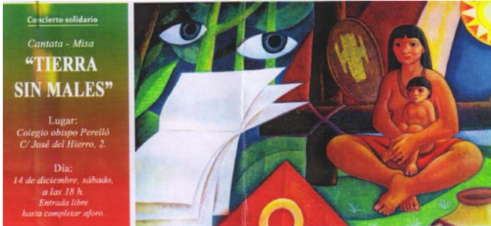
Invitación del concierto en Madrid.

Desde su estreno en Soria el 2-06-2011 hasta final del 2013, hemos dado conciertos, presentando la cantata, en Salamanca y Palencia en el 2011; Santander, Burgos y Soria con la Joven Orquesta, además de presentarla en video en Madrid, en 2012; y Vitoria, Majadahonda, Madrid y Zaragoza en el 2013. La crítica y valoración de esta actividad es muy positiva. Nos siguen solicitando llevarla a otras ciudades.